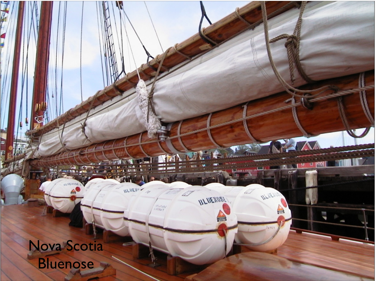
Nova Scotia Bluenose